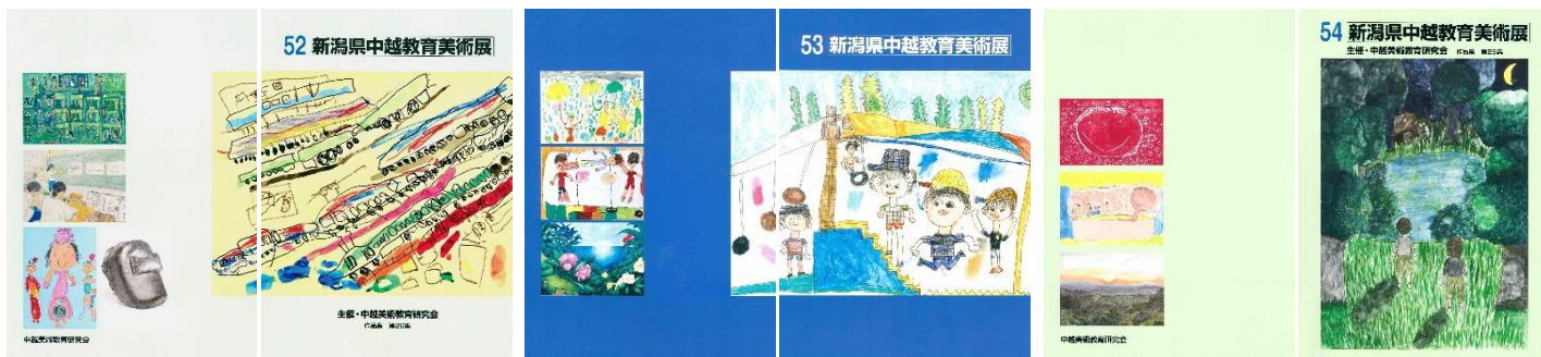
過去の特別賞作品写真を掲載した作品集を 500 円で販売しております。

中越教育美術展ホームページ http://tyuubiten.org/index.html